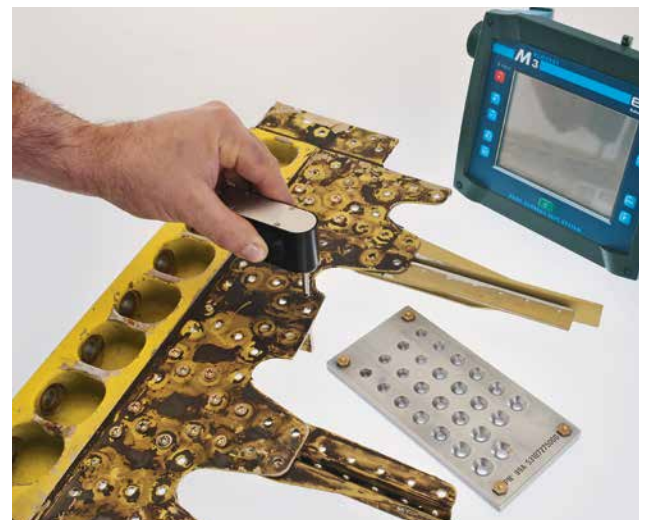
Bohrungsprüfung mit Minirotor an Aluminiumstrukturen