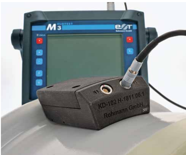
Manuelle Oberflächenrissprüfung mit angepasstem Kontursensor