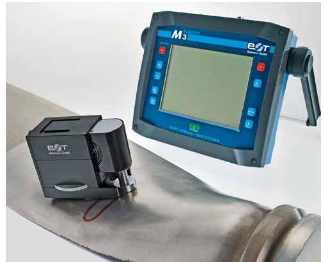
Dynamische Oberflächenrissprüfung am Rotorblatt