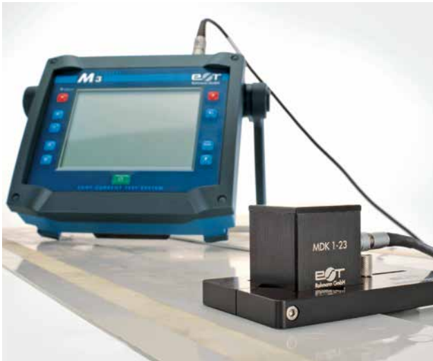
Prüfung auf verdeckte Risse in Aluminium-Nietstrukturen