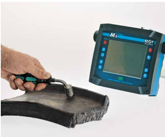
Prüfset für raue Umgebungsbedingungen mit Riss-Indikation direkt am Sensor über LED