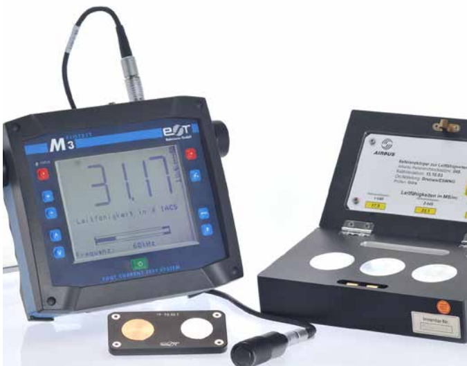
Leitfähigkeitsmessung in IACS oder MS/m von 1 % bis 110 % IACS