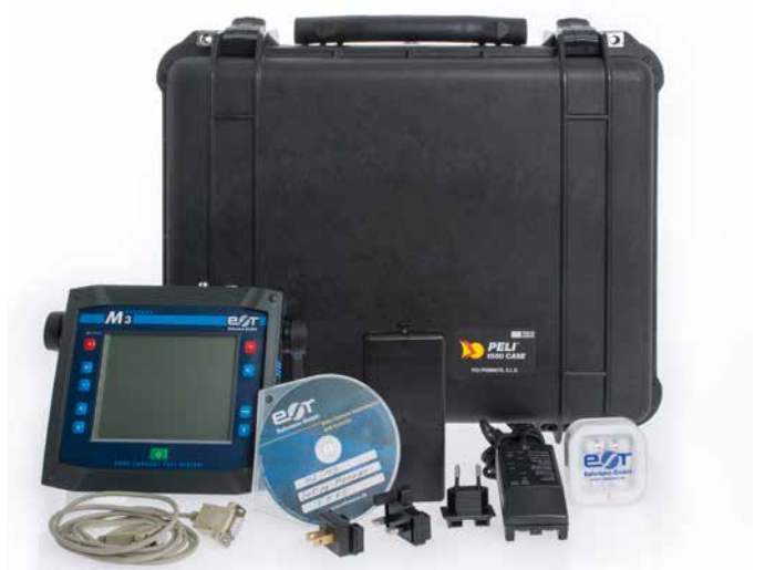
ELOTEST M3 im Set